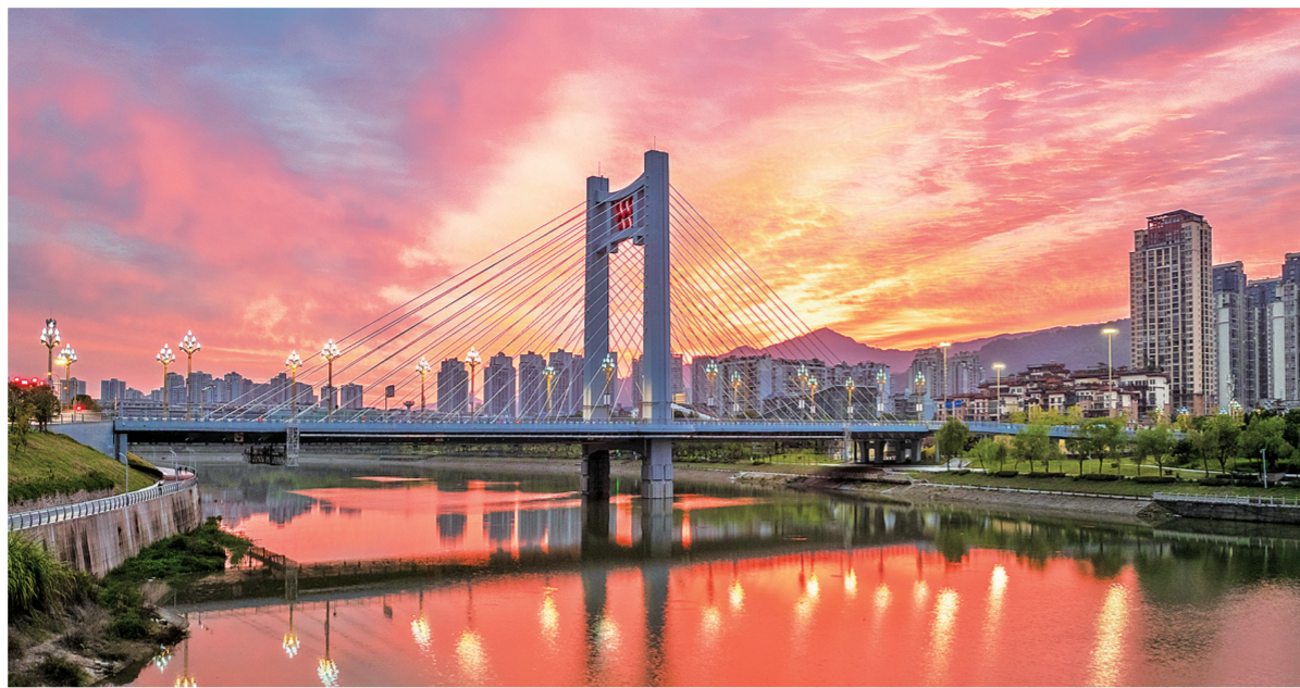
开州大桥。

湖公园正式开园。开园以来,每到周末或节假日,不少市民就会走进这座新的城市花园客厅,他们三五成群,谈笑风生,或拍照打卡,或湖边歌唱,或体验各式游玩项目,尽享悠闲时光。